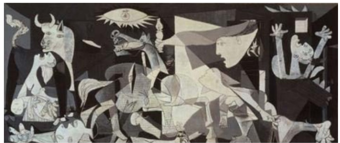
Pablas Pikasas (Pablo Picasso). Gernika (1937)

1937 m. balandžio 26-oji: nacių bombardavimas, nuo kurio prasidėjo Europos katastrofa. Parengė Milda Augulytė. Interneto prieiga: https://kultura.lrytas.lt/istorija/2017/04/28/news/1937-m-balandzio-26-oji-nacių-bombardavimas-nuo-kurio-prasidejo-europos-katastrofa-984004/ [žiūrėta 2019-12-04]