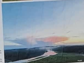
„Merkinėje, kaip pasakoje“