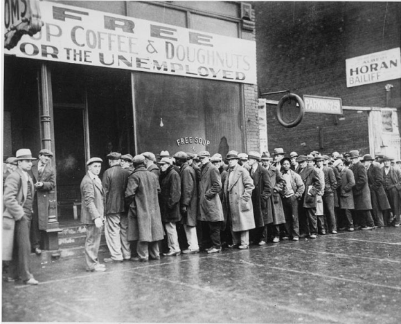
Virš durų „Nemokama sriuba, kava ir spurgos bedarbiams“.

Suderinus iškabos užrašą su stovinčia link įėjimo nusidriekusi didele eile žmonių, galima daryti prielaidą, kad eilę sudaro darbo netekę žmonės. Kokie tai žmonės? Pirma, įvairių rasių, nes tarp daugumos baltaodžių matome ir keletą juodaodžių. Antra, įvairių buvusių socialinių grupių atstovus, nes greta dėvinčių paprastas kepures ir vilkinčių suglamžytomis kelnėmis, matome skrybėliuotus, nepriekaištingos kokybės paltais dėvinčius ir kaklaraištį ar net varlytę pasirišusius vyrus. Veiksmas vyksta 1931 m. Jungtinėse Amerikos Valstijose, nes yra nuoroda, kad nuotrauka daryta Čikagoje. Suderinę su turima informacija apie 1929 metais prasidėjusią „didžiąją krizą“, galime daryti prielaidą, kad ji 1931 m. Jungtinėse Amerikos Valstijose tikrai palietė praktiškai visus visuomenės sluoksnius.