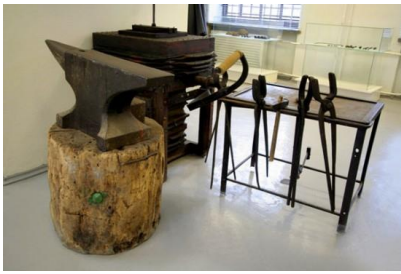
G. Kackės darbo įrankiai.

Antrajame muziejaus aukšte eksponuojami Klaipėdos krašto kapinių kryžiai, tvorelės, varteliai, Didžiosios Lietuvos kryžiai-saulutės, architektūrinės Klaipėdos senamiesčio namų detalės, žvejybos įrankiai, namų apyvokos daiktai. Ši ekspozicija atspindi dviejų kultūrų – Didžiosios ir Mažosios Lietuvos – pėdsakus. Mažosios Lietuvos kryžiai puošti augaliniu ornamentu. Didžiosios Lietuvos, ypač Žemaitijos, kryžiai puošti saulutėmis, žvaigždutėmis, žalčiais, mėnuliais ir kitais pagonybės simboliais. Pagal eksponatų išdėstymą salėje išryškėja dviejų kultūrų skirtumai.